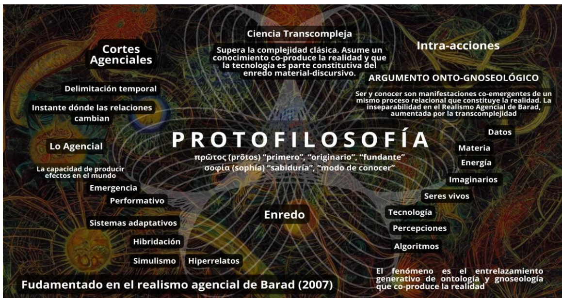
Imagen 1. Protofilosofía.

Desde esta perspectiva, la protofilosofía transcompleja no aspira a constituirse como doctrina dogmática, sino como un plano del pensamiento para la re-creación ontológica, donde los conceptos aún no se han fijado definitivamente. Esta condición la vuelve especialmente pertinente para acompañar una ciencia que reconoce la indeterminación, la no linealidad y la relacionalidad como rasgos constitutivos de la realidad. En la imagen 1, se puede observar como la protofilosofía surge desde el enredo fenoménico y se integra en las categorías que emergen.